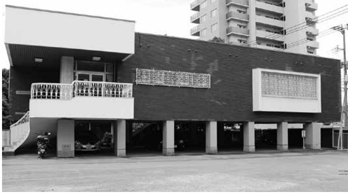
今の歴史資料館。1階は駐車場