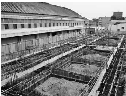
基礎工事が進むE棟

力「楽天」などの碑群は、 そのまま現地に残ります。 図書館跡は駐車場として 整備され、自動車の校門 を新設。思い出深い正門は 残ります。全ての改築が完 成後、平成31年に母校は1 40周年を迎えることにな ります。