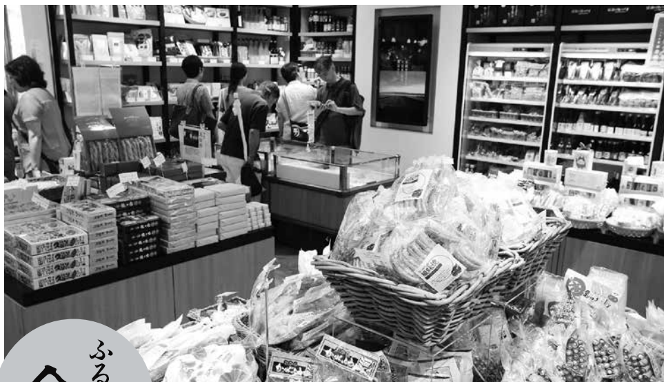
調味料から銘菓、日本酒まで約600種類の商品が満載