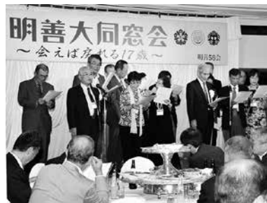
校歌を熱唱する皆さん

皆様のご理解とご協力により、「第49回明善大同窓会」を1074名の参加者を得て盛会のうちに無事終えることができました。ことに、心より感謝申し上げます。「楽しんでやれよ！」と先輩方から何度も声をかけていただきました。決して楽ではなかったけれども楽しくやれたと言っているのが終わって初めて一番の感想です。毎回、実行委員会後の居酒屋では「会えば戻れる17歳」のテーマそのままに、恋愛ネタ、部活ネタ、失敗談、武勇伝…と昔話に花が咲き、いつも同じ話で 同じように大笑いしていました。そんな一見不毛に見えるバカ話の繰り返しにも、「えっ！そんなことがあったと？」と驚く者があったり、「話したこともなかったけど、あんな面白かったねえ」と意気投合したり、37年前には知らなかったことや知らなかった者同志が、集まる度に「つながっていった」ことが、私にとってとても大きな喜びでした。この「出会い直し」が今回の財産であり、この魅力こそが明善の伝統の力であることを実感しています。17歳に戻った我々は、 今度は5年後に迎える還暦に向かって新たなスタートを切りました。今後も56会らしく、明善生らしく、楽しんでやっていこうと思っています。 最後に、昨年の近畿支部キャラバンでアピールタイムのネタとして披露した「久留米にわか」の一つをご紹介します。お礼のご挨拶を終わります。 「あんな明善の新しか校舎を見たの？バサラかきれいになったってビックリしたばい」 「オレ達のおった頃の明善校舎も古うして、汚なかな」 「そうそう。バツテンさ、あげん綺麗になっとならゴミひとつ落ちとらんめいな？」 「そげんたい。今あそこにあるとは、明善の誇り(埃)だけだいな」