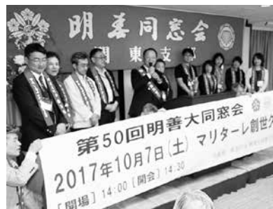
大同窓会をしっかりとアピール

年卒の皆さんで結成されたキャラバン隊からは、大同窓会のPRや前売り券販売を実施いただき、今年も大同窓会を迎える気分が盛り上がりつつありました。また、久留米市東京事務所からは、新橋にオープン予定のアンテナショップ「福岡久留米館」のご紹介をいただき、お土産として久留米ラーメンをご提供いただきました。