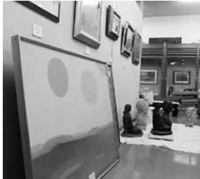
整理を待つ収蔵資料たち

1階駐車場は収蔵庫になります。書庫のスライド式の保管棚も1階に移動。資料展示室を全面リニューアルします。会議室は洋室にし、トイレなどの水回りも改修。スリッパに履き替えていた床はフラットにし、そのまま進めます。