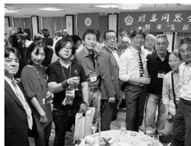
テーブルでは思い思いに記念撮影

年卒の皆さんで結成されたキャラバン隊からは、大同窓会のPRや前売り券販売を実施いただき、今年も大同窓会を迎える気分が盛り上がりつつありました。また、久留米市東京事務所からは、新橋にオープン予定のアンテナショップ「福岡久留米館」のご紹介をいただき、お土産として久留米ラーメンをご提供いただきました。